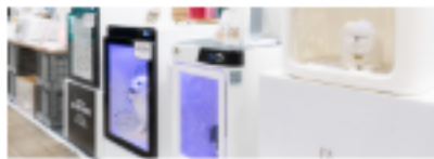
IT·기타 | IT 용품·서비스·헷 등반 시설 -