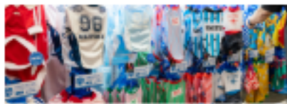
의류&악세서리 | 의류·악세서리 -