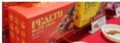
사료&간식 | 사료·간식·동결건조 -