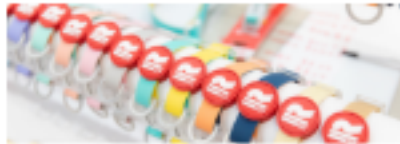
외출&놀이 | 장난감·허네스·유모차·슬링백 -