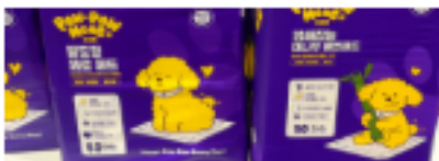
위생&패션 | 배변패드·합취제·플라너 -