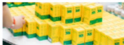
헬스케어 | 영양제·유산균·보조기구 -