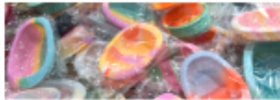
리빙용품 | 하우스·방석·패드·계단·식기 -